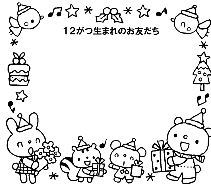
12がつ生まれのお友だち

年末年始は何かと慌ただしい時期ではありますが、大掃除やお正月の準備など、お子さんも参加できることは、是非お手伝いをさせてあげてくださいね。また、体調にも十分気を付けながら、ご家族お揃いで充実した冬休みをお過ごし下さい。